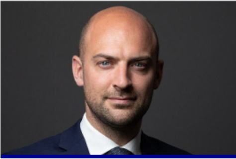
JEAN-NOËL BARROT Ministre délégué chargé de la Transition numérique et des Télécommunications

« L'écosystème de la French Tech est dynamique, divers et ambitieux. Mais surtout, il est présent partout : dans les grandes villes et les plus petites, en France et à l'international, à travers les entrepreneuses et entrepreneurs qui l'incarnent et les Capitales et Communautés French Tech qui les rassemblent. Grâce à ce réseau à la configuration inédite, des idées naissent et se développent jusqu'à devenir de vraies réussites entrepreneuriales.